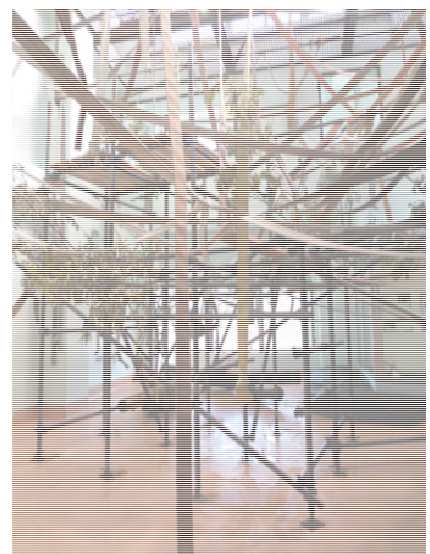
屋内運動場の内景

キンシコウは展示スペースが工事中で一般展示はなかったが、バックヤードからみることができ、美しい毛並みを間近に見ることができた。そのほか、興味深かつ