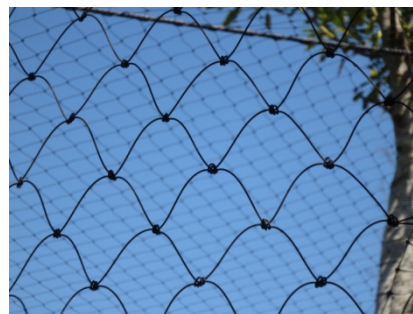
ニホンザルの展示施設で使用されていた極細のネット

たのは、ニホンザルの展示施設で使われていたネットであった。細い素材で目立たないが強度はあり、展示に大変向いていると感じた。目立たないので保守点検がしにくいという欠点はあるが、使い方次第では面白い素材であると思った。