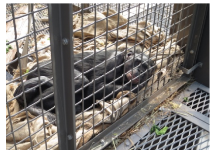
麻袋でつくった巣で寝転ぶボノボ

また、エンリッチメントの一環として行われているひなまつりのお祝いも見学でき、ほほえましく感じた。