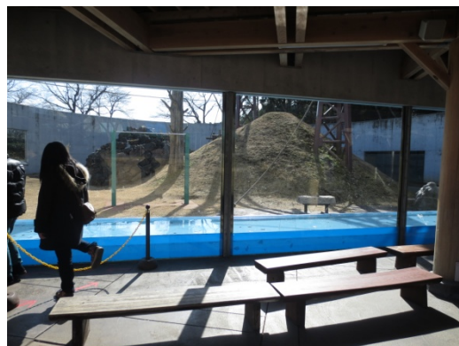
屋外放飼場『チンパンジー学習の森』

チンパンジーの飼育スペースは獣舎のほか、チンパンジー学習の森と名付けられた屋外放飼場があり、飼育頭数 2 頭に対して十分なスペースがあった。また、2 頭ともゆったりと過ごしている感じを受けた。私設の動物園で飼育されているチンパンジーを見学できたのはよい経験であった。