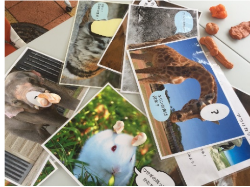
Figure 5. 粘土コーナーの様子。キリンの角やゾウの鼻など、知っているように思えるが、実際に手を動かして形を作ってみると案外難しい。