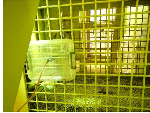
Figure 2. 実験に参加していないチンパンジーもジュースが飲めるように器具を設置した。他のチンパンジーが実験参加者の邪魔をしないようにするためである。

「野生動物学のすすめ」では、WRC を紹介するブースを出展した (Fig. 4)。ブースでは、WRC の学生の活動を紹介する冊子の配布や、粘土で動物の体をつくる体験コーナーを設けた (Fig. 5)。動物の特徴的な身体部位 (例：ゾウの鼻・キリンの角) を隠した台紙の上に、粘土でその身体部位を作ってもらった。このような体験を通じて、動物の体についてより深く知ってもらおうことを目指した。粘土を使って実際に手を動かしてもらえるようにしたことで、子どもたちに楽しんでもらったのではないかと思う。