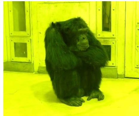
Figure 3. 部屋の片隅に座るオスのジェームス。なかなか実験に参加しようとしな。モニターにメスのチンパンジーの写真を表示すると、ジュースは飲まずに写真だけ見に来た。

反省点として、今回は屋外での出展であったため、風が吹いたときに物が飛ばされる事態が多発した。そのため、他の体験（チンパンジー顔写真の神経衰弱ゲーム）はあまりできなかった。重しやテープ、マグネットなどを用いて屋外にも対応できるよう、事前に配慮すべきであった。