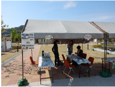
Figure 4. ブースの様子。