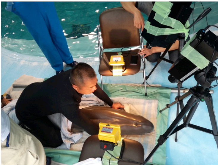
写真：スナメリが機材で怪我をしないよう保定しながらの撮影（プールサイド）